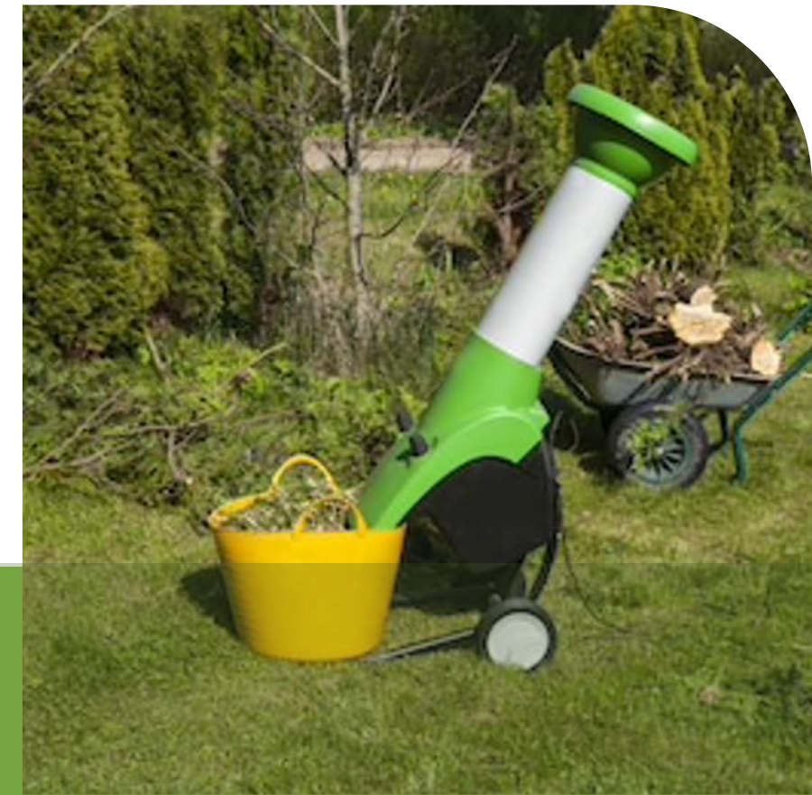
Location de broyeurs